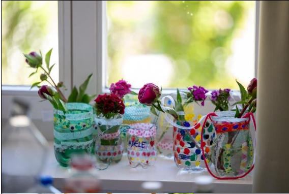
Es wurde kunstvoll gebastelt.