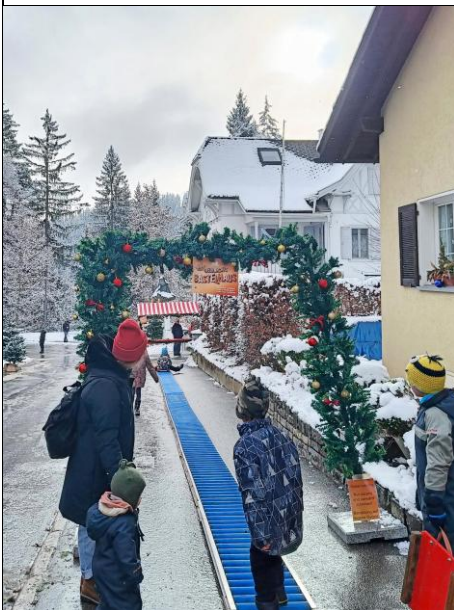
Die Rollenrutsche hat gross und klein zur Casa Caumasee gebracht.