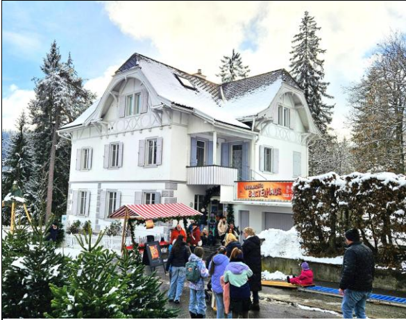
Es war einiges los im Weihnachts-Bastelhaus